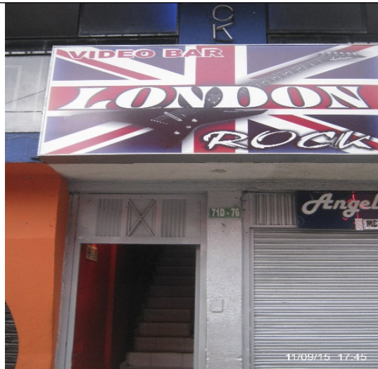
Fotografía No. 2: LONDON ROCK, ubicado en la dirección Calle 6 Sur No. 71D – 76 PISO 2

Registro fotográfico, Visita No. 2 efectuada el día 02/10/2015