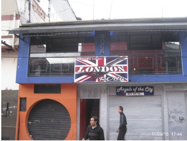
Fotografía No. 1: LONDON ROCK, ubicado en la dirección Calle 6 Sur No. 71D – 76 Piso 2